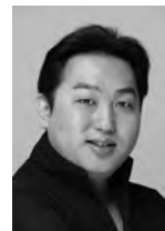
バリトン 吉川 健一