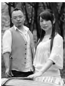
薫風之音(くんぷうのおと)

尺八×箏×ヴァイオリン×ピアノによる和と洋の響きで、古くから伝わる伝統的な音楽や、馴染みのあるポピュラー曲をお届けします。ふだんあまり触れることのない和楽器の魅力を感じてみませんか？